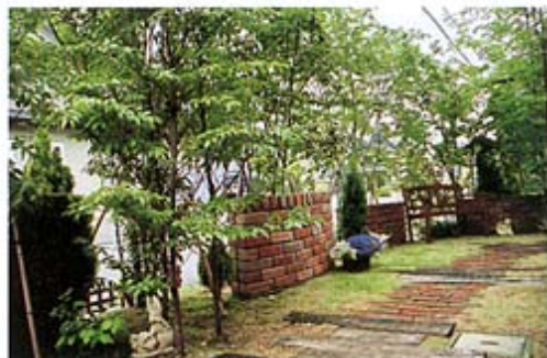
③樹木の目隠しでプライベート空間を確保しています。