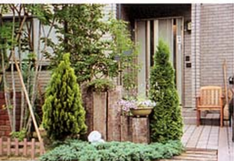
②玄関前も植物と枕木でまとめています。

角地に建つK邸。庭づくりにおいて、自然をテーマにプランすることが多いのですが、こちらの実例は、まさに自然というテーマにピッタリのプランとなりました。 前面道路はわりと人通りが多いのですが、特に高さのある壁をつくって敷地内のプライバシーを確保するようなことをせず、樹木を利用した目隠しを考えました。 枕木に積んだレンガはゆるやかなR(曲線)を描き、樹木同士をつないでいくようなラインにしました。まるで高原にいるような気持ちで、レンガの小道を歩くことができます。