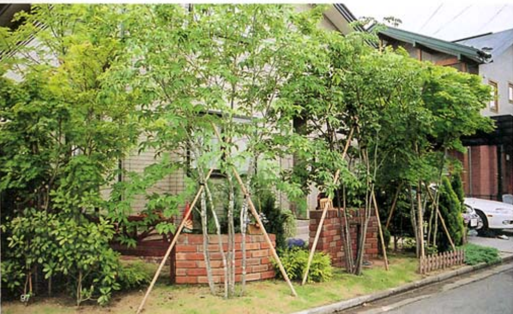
⑤道路に面した庭を樹木で目隠しすると、通りがかりの人の目にもやさしい。

建物、周囲の環境、そして視線や人・車などの動線をうまくデザインに取り入れること、そして何よりも住む人のライフスタイルにあったプランを心掛けています。